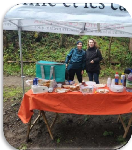
Présence dans les ravitaillements

Il est à noter que les marcheurs ont, malgré les conditions météorologiques, été ravis par les parcours proposés (paysages, dénivelés,...).