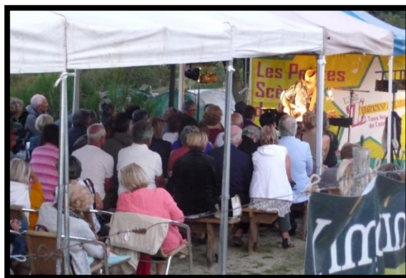
Musique en plein air

Cette manifestation a été organisée avec l'aide de l'Office de Tourisme de Saint-Etienne-Métropole.