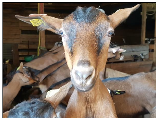
Exposition de chèvres

Notre engagement auprès des éleveurs, fait découvrir le monde agricole et ce métier de chevrier, ce qui nous permet aussi de valoriser et faire connaître notre commune.